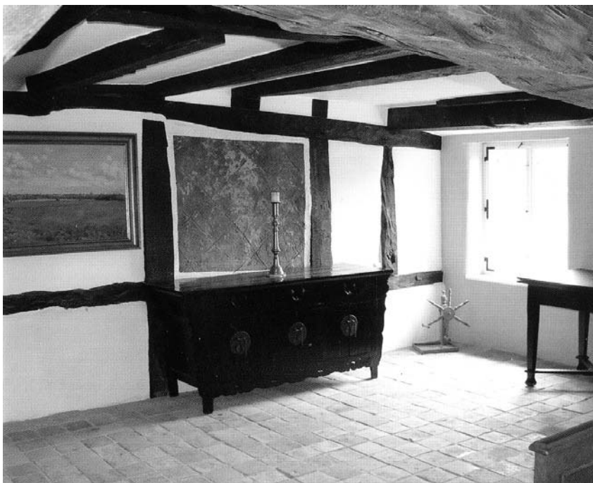
Einladend: Das Hochzeitszimmer in der Historischen Mühle Freienhagen

Liebevoll historisch restauriert und authentisch eingerichtet, bietet das Kulturdenkmal Mühle Freienhagen im Wattertal Gästen allen modernen Komfort. Jedes der sechs Zimmer ist individuell möbliert. Und am Mühlentag lockt zusätzlich ein Konzert.