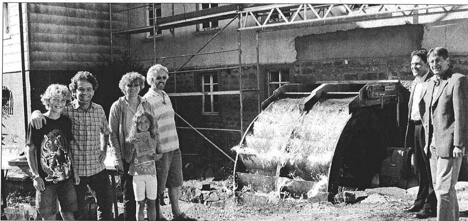
Nach 15 Jahren Pause wird in der Heckenmühle in Wald-Michelbach wieder Wasserkraft genutzt. Auch Bürgermeister Joachim Kunkel (rechts) machte sich ein Bild von der neuen Anlage.

Die Heckenmühle wird auch mit eigenem Quellwasser versorgt. Außer Müll- und Abwassergebühren fallen dann in Zukunft keine Kosten an, im Gegenteil, der Überschuss aus der Stromproduktion wird an den Energieversorger verkauft.